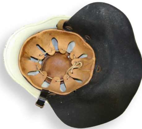
Helm nach DIN 14940 mit Lederpolster-Innenteil