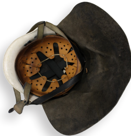
Helm nach DIN EN 443 mit Gewebetragbändern und Isolationsschicht

angehörigen im aktiven Dienst bei Übung und Einsatz Helme ausschließlich nach DIN EN 443 vorgeschrieben. Ausnahmen oder Übergangsfristen wurden nicht definiert.