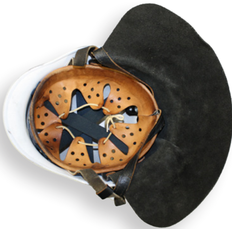
Helm nach DIN 14940 mit Innenteil und Gewebetragbändern