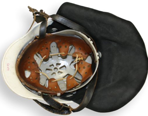
Helm nach DIN 14940 mit Kunststoff-Innenteil